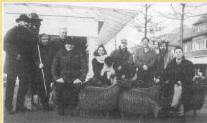
Die Redakteure aus allen Munsteraner Kirchengemeinden.

manchmal un bequem. Aber nie hält er damit hinterm Berg, dass er für die christlichen Gemeinden in Munster schreit und für ihren Glauben an Gott wirbt. Statt Ihres gewohnten Gemeindebriefes finden Sie nun diesen „Hahnenschrei“ regelmäßig