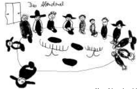
Das Abendmahl, gezeichnet von den Vorkonfirmanden

sehr nachdrücklich, dass dieser Weg richtig ist. Über den Kindergottesdienst und das neue Konfirmandenunterrichtsmodell mit Zehnjährigen erhoffen wir uns eine Belebung der Jugendarbeit.