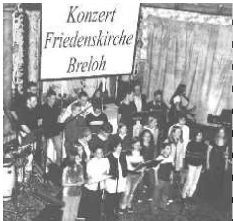
Nähere Informationen zum Konzert auf der Ökumene-Seite (Seite 2).