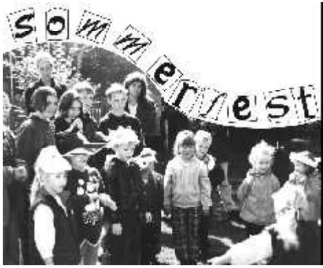
Am 9. September feierten die Kinder des Ev. Kindergarten Lebenshaus das diesjährige Sommerfest. Unter dem Motto: Wir gehen in den Märchenwald. Es war in jeder Hinsicht ein märchenhaftes Fest - und für die neuen Kindergartenkinder ein ganz besonderer Tag.