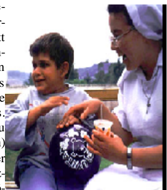
Kleiner Patient

aber sehr klein in der Durchführung derselben. So wurden uns drei Hilfslehrerstellen gestrichen. Als sie uns auch unsere fünf freien Lehrerstellen (wofür sie das Geld seit Januar vom Staat bekommen) nicht einmal mit Kurzverträgen besetzen wollten, haben wir einen Aufstand gemacht (mit Eltern, Fernsehen usw.) Jetzt wurden sie bewilligt, aber die Lehrer haben bis heute noch keinen Vertrag und auch kein Geld erhalten. Nun müssen wir zwei Gehälter von Spendengeldern übernehmen, da ich unsere kleinen und mehrfach behinderten Schüler nicht ohne Hilfspersonal lassen kann. Im Kinderheim Santa Dorothea konnten wir von 20 Kindern wegen Personal-mangel nur sechs Kinder aufnehmen. In der Schule und noch mehr in der Werkstatt macht uns ein anderes Problem zusätzlich zu schaffen: Wo bleiben die Jugendlichen, die wir nicht