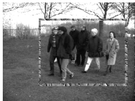
Wir hatten auch die Gelegenheit, den beginnenden Frühling bei einem Spaziergang am Steinhuder Meer zu genießen.