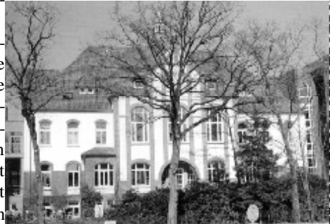
Das Diakonissen-Mutterhaus heute

Die anschließende Führung durch das mächtige und wunderschöne Haus mit vielen alten Dingen war sehr beeindruckend. Vor über 140 Jahren damit begann die Arbeit der Schwesternschaft durch Elise Averdick in Hamburg, die dort die ersten Kranken und Hilfsbedürftigen aufnahm. Mit ihrer Schwesternschaft - es waren inzwischen 62 - siedelten sie 1905 nach Rothenburg um. 1906 war der Bau des Mutterhauses beendet und die Fürsorgetätigkeiten konnten im vollen Umfang aufgenommen werden.