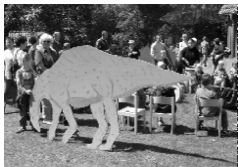
Die Dinos erobern den Kindergarten

Am 3. Juli feierte der Kindergarten sein Sommerfest unter dem Motto „Dinosaurier“. Wochenlange Vorbereitungen ließen das Fest reibungslos verlaufen. Dinosaurierfahrten lockten die Besucher ins Dinoland.