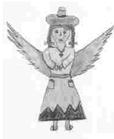
Engel, gemalt von den Kindern aus Cajamarca

Ihr Lieben, Zum bevorstehenden Weihnachtsfest möchte ich euch allen einen Engel senden, den die Heimkinder für euch malten. So, wie abgebildet, sehen unsere Kinder „ihren“ Engel.